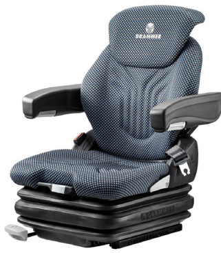
PRIMO® XL Komfortsitz für Gabelstapler und kompakte Baumaschinen

Trotz niedriger Aufbauhöhe bietet der PRIMO® XXL ein Maximum an Federweg, was in Verbindung mit der Niederfrequenztechnologie eine sehr gute Dämpfung sicherstellt. Mit der per Knopfdruck einstellbaren pneumatischen Gewichtseinstellung lässt sich insbesondere bei häufigen Fahrerwechseln schnell und einfach das korrekte Fahrergewicht justieren. Zusätzlichen Fahrkomfort bieten die ergonomische Sitzpolsterung und eine extralange Rückenlehne mit mechanischer Lordosenstütze. Standardmäßig verfügt der PRIMO® XXL über ein duosensitives ELR-Gurtsystem und einen Sitzkontaktschalter.