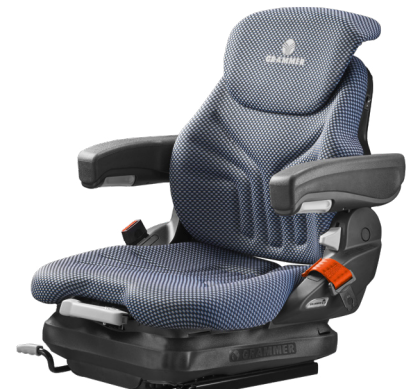
PRIMO® XM PLUS Standardsitz mit mechanischer Federung

Der PRIMO® L PLUS verwöhnt Fahrer:innen mit einer 50 mm breiteren Sitzfläche (im Vergleich zum PRIMO® L). Die mit 12 oder 24 V betriebene pneumatische Federung mit reduziertem Federweg ermöglicht effizienten Schwingungsabbau selbst in kleinsten Fahrerkabinen. Die Einstellung des Fahrergewichtes erfolgt durch einen ergonomisch angebrachten Taster. Ein Schauglas mit Zeiger hilft, die optimale Einstellung zu finden. Der Sitz erfüllt die neuesten Sicherheitsanforderungen und ist serienmäßig mit Sitz- und Gurtkontaktschalter sowie duosensitivem ELR-Gurtsystem mit orangem Gurtband ausgestattet.