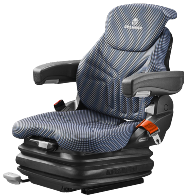
PRIMO® XL PLUS Komfortsitz mit pneumatischer Federung

Die PRIMO® PLUS Modelle mit extrabreiten Polstern und Sitzoberteilen.