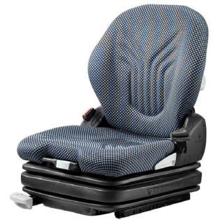
PRIMO® L Standardsitz für Gabelstapler und kompakte Baumaschinen

Der PRIMO® XL ist mit einer niedrig aufbauenden Niederfrequenzfederung ausgestattet, die entweder mit 12 oder 24 Volt betrieben wird und für hervorragenden Fahrkomfort sorgt. Das Fahrergewicht lässt sich mithilfe der pneumatischen Federung ganz einfach per Knopfdruck von 45 bis 170 kg einstellen. Das bequem ausgeformte Sitzoberteil und die Lordosenstütze können optimal auf die individuellen Bedürfnisse der Fahrer:innen eingestellt werden, so dass jederzeit eine hohe Arbeitsergonomie gewährleistet ist. Standardmäßig verfügt der PRIMO® XL über ein duosensitives ELR-Gurtsystem und einen Sitzkontaktschalter.