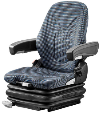
PRIMO® XXL Komfortsitz für Schubmaststapler und kompakte Baumaschinen

Unsere PRIMO® Modelle mit pneumatischer Federung.